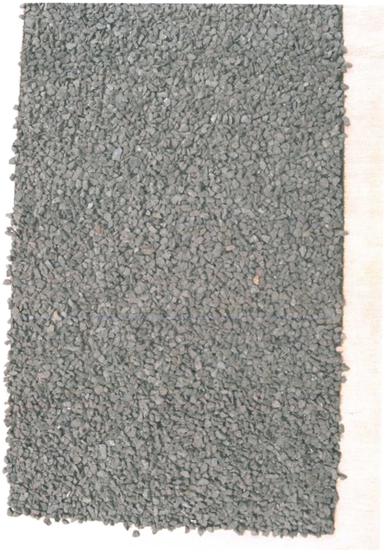
Mandurax pigment zwart